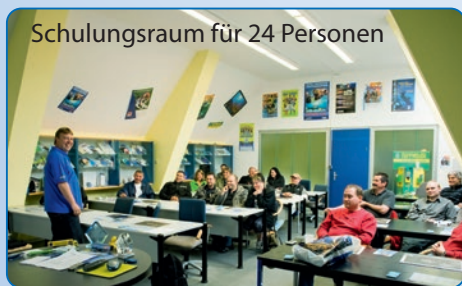
Schulungsraum für 24 Personen

» Nach jedem IDC in Fuldas Tauchertreff findet der IE in Fulda statt. Hier bekommst Du natürlich volle Unterstützung während Deiner Tauchlehrerprüfung IE durch die Course Directoren und den Staff.